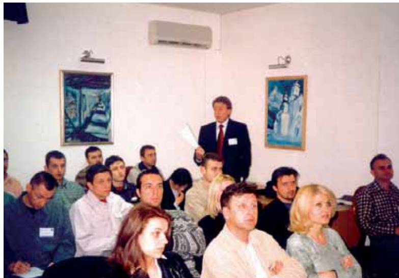
Београдски форум новинара (март 2003.) Belgrade Media Forum (March 2003)