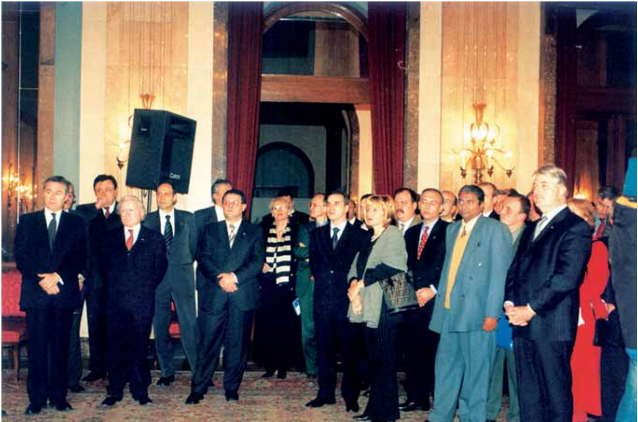
Са званичног отварања у Скупштини града Београда, 17. децембар 2001. године Taken at the formal opening ceremony in the Belgrade Assembly, December 17th 2001

На Скупштини светске Асоцијације атлантских организација одржаној од 2. до 7. октобра 2001. на Бледу у Словенији, Атлантски савет Југославије је, као званични представник наше државе, примљен у чланство те организације која окупља сличне организације из 40 земаља. Тиме је трајно одредио и своје основне циљеве, који су и циљеви Светске асоцијације, засновани на Повељи Уједињених нација: чланице ове асоцијације истичу своју жељу да живе у миру са свим народима и владама, да штите слободу и цивилизацију својих народа која је заснована на начелима демократије, индивидуалне слободе и владавине права, али и да теже унапређењу стабилности и благостања у евроатлантској области, и да уједине своје народе ради колективне одбране и очувања мира и безбедности. Још конкретније ови циљеви би се у нашој земљи могли разврстати у следећих десет тачака: