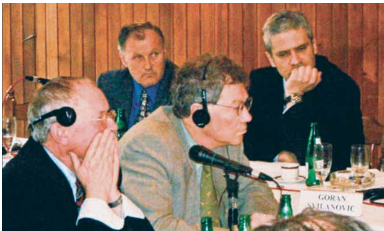
Са састанка у Моровићу 9-10. мај 2002. године / Taken at the meeting in Morovic, May 9-10, 2002.

We, on the other hand, thought differently: that the situation for such initiative was ripe in our country as well, and, together with a group of enthusiasts we commenced work on the realization of the plan aimed at establishing a non-governmental organization on the territory of the then-Federal Republic of Yugoslavia, which would stimulate Euro-Atlan-