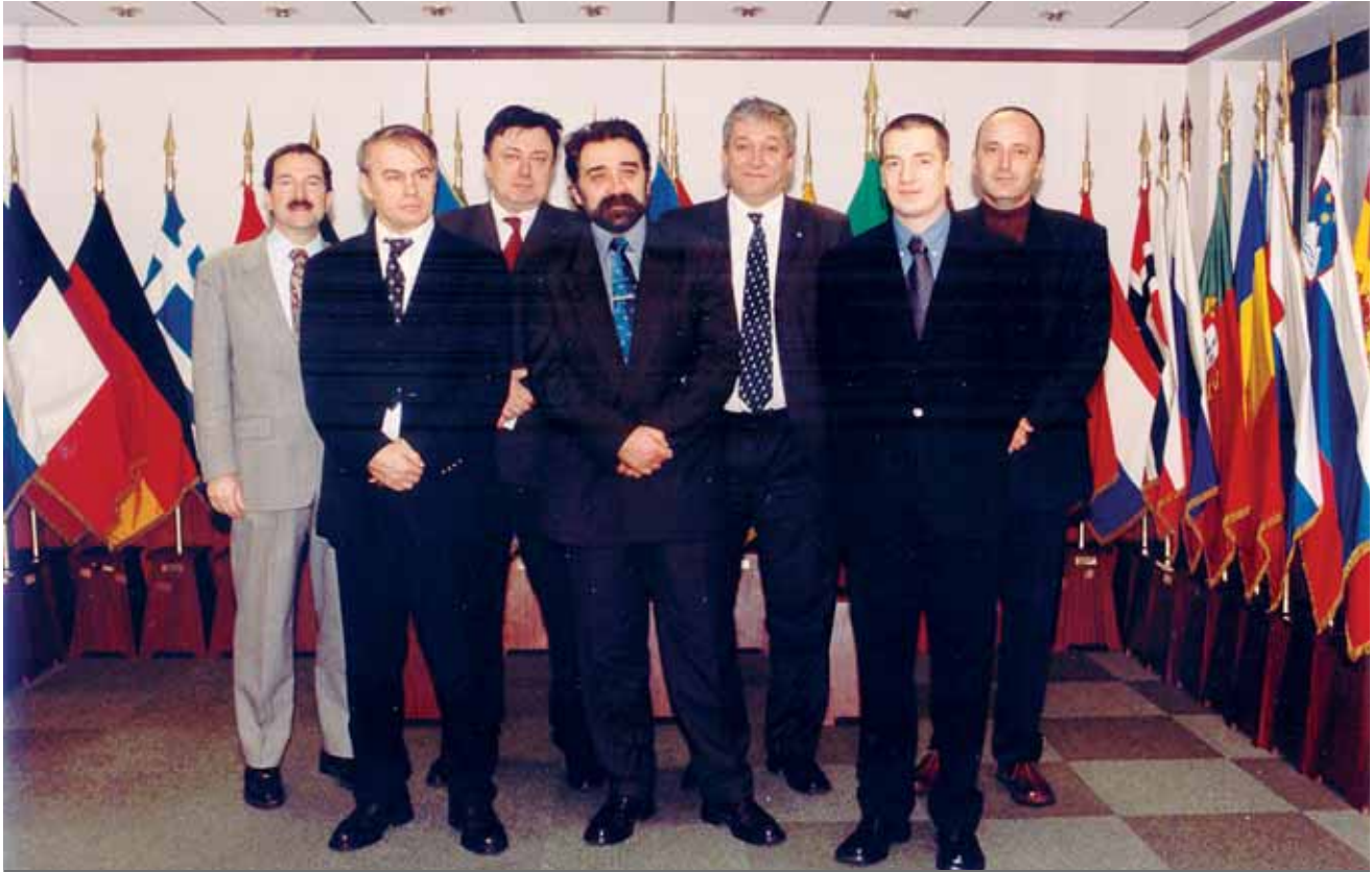
Делегација нашег Атлантског савета у седишту НАТО-а у Бриселу The Atlantic Council delegation at the NATO Headquarters in Brussels

може да представља моћан економски ослонац за финансирање разних терористичких активности, како у региону, тако и у осталим деловима света.