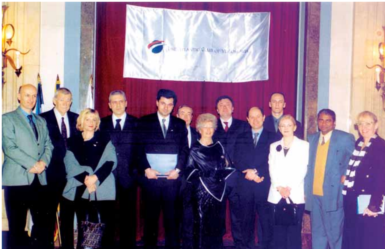
Са званичног отварања у Скупштини града Београда, 17. децембар 2001. године Taken at the formal opening ceremony in the Belgrade Assembly, December 17th 2001

Fourthly, the ACSM shall continue to support the foreign policy orientation of the new democratic authorities, insofar as we advocate peaceful resolution of all disputes and conflicts,