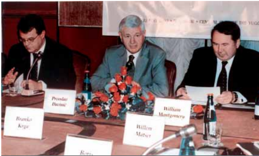
Конференција “Безбедносни изазови на југоистоку Европе” (мај 2002.) Conference: “Security Challenges in South-Eastern Europe” (May 2002)