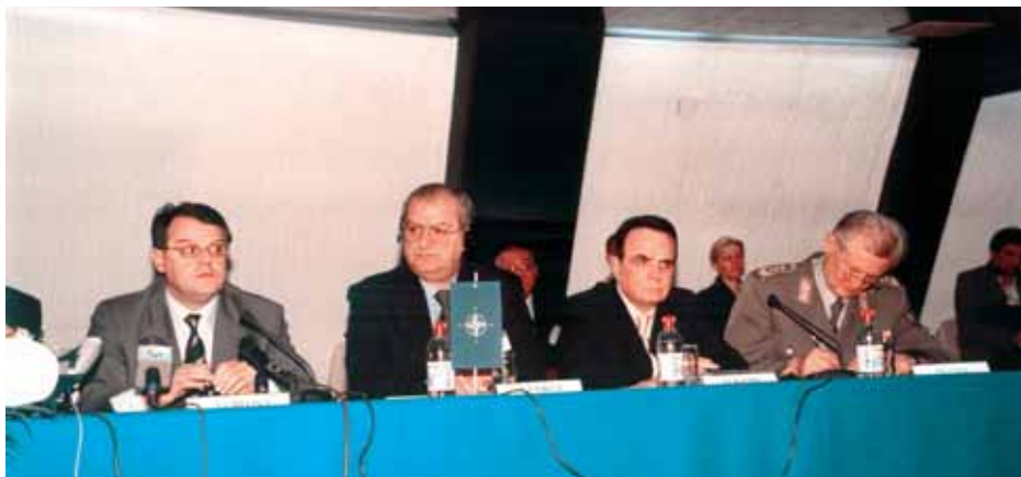
Конференција „СЦГ – пут прикључења евроатлантским интеграцијама“ (мај 2003.) Conference: “SM – the road to joining Euro-Atlantic integrations” (May 2003)

The participants of the conference were representatives of Euro-Atlantic organizations from NATO member countries, the region of South-East Europe, NATO representatives, as well as official state representatives of Serbia and Montenegro. Apart from that, the conference was also attended by the representatives of the diplomatic and military-diplomatic core from the NATO and Partnership for Peace member