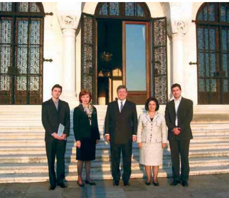
Пријем у Белом двору (октобар 2005.) Reception at Beli Dvor (October 2005)