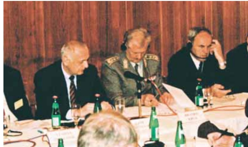
Са састанка у Моровићу 9-10. мај 2002. године Taken at the meeting in Morovic, May 9-10, 2002.

tic integrations. In March 2001, first we travelled to Bulgaria. The members of this county's Atlantic Club introduced us to their ten-year activities which enabled this former member of the Warsaw Pact Organization to become the member of - NATO! They told us about the difficulties they had en-