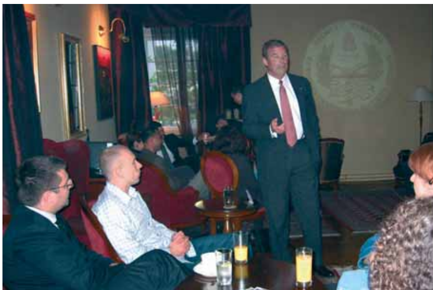
Николс Прат држи предавање (мај 2005.) Nichols Pratt holding a lecture (May 2005)

13 May - The Atlantic Council of Serbia and Montenegro hosted a delegation from the National War College from