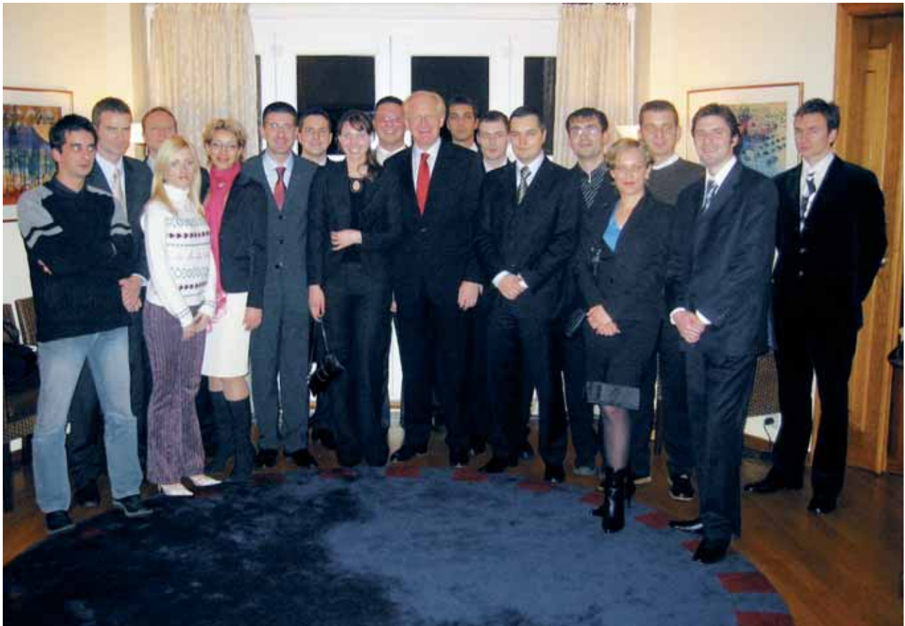
Млади лидери СЦГ у седишту НАТО-а / Young SCG leaders in the NATO headquarters

Thereupon, the Youth Organization of the ACSM began to