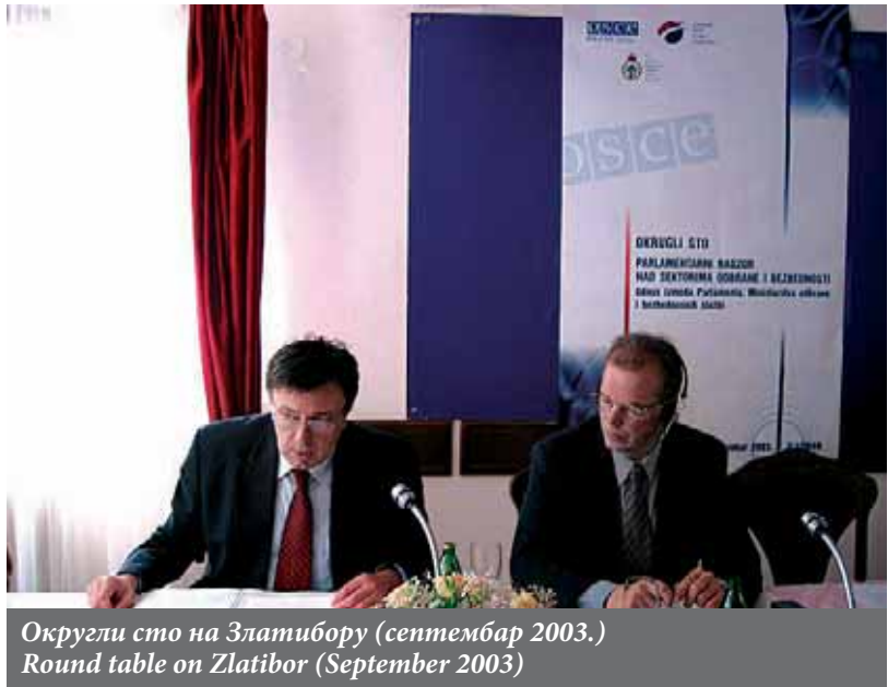
Округли сто на Златибору (септембар 2003.) Round table on Zlatibor (September 2003)

One session of the conference was devoted to the future operation and perspectives of the Atlantic Treaty Association activities.