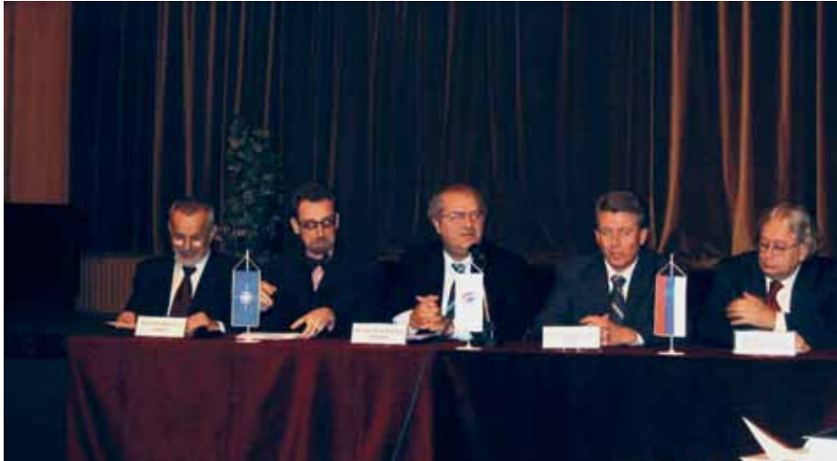
Трибина “НАТО на Балкану” (март 2004.) Public discussion “NATO in the Balkans (March 2004)

наилазили на изузетан пријем код грађана Србије. Посебно добра била је реакција студената, представника локалне самоуправе, старешина Војске СЦГ и пословних људи, који су исказали велико разумевање и интересовање за што бржи пријем Србије и Црне Горе у све евроатлантске интеграције.