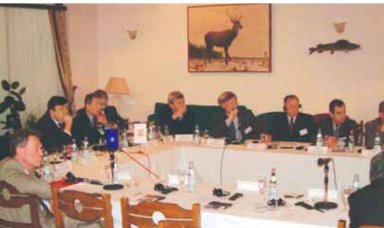
Са састанка у Моровићу 9-10. мај 2002. године Taken at the meeting in Morović, May 9-10, 2002.