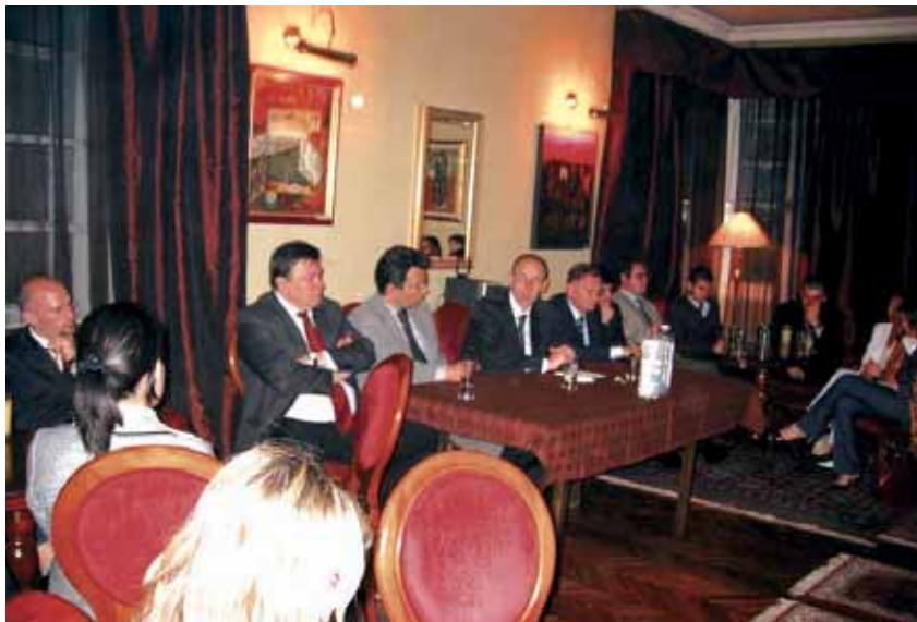
Делегација из Беча у Атлантском клубу (мај 2005.) The Vienna delegation in the Atlantic Club (May 2005)