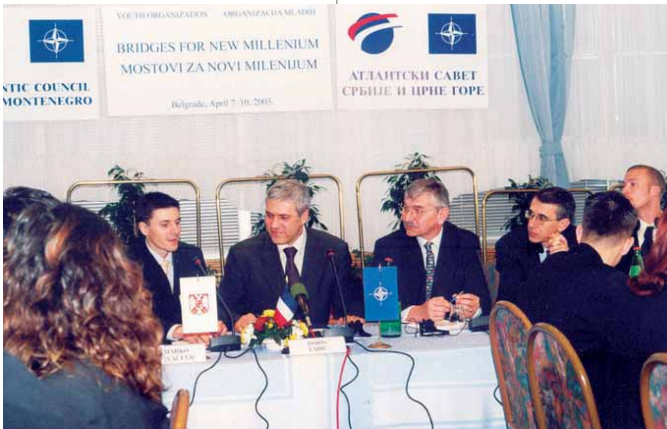
Конференција "Мостови за нови миленијум" / Conference Bridges for New Millenium

And what were those common goals, values and ideas which