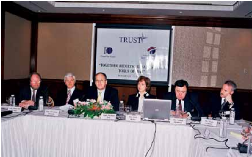
Радионица у хотелу "Хајат" (април 2005.) Workshop at the "Hayat Regency Hotel" (April 2005)

тим председавајући атлантских организација из земаља НАТО-а и Партнерства за мир ( Канада, Велика Британија, Холандија, Русија, Португалија, Словенија, Чешка Република, Бугарска, Грчка, Македонија, Албанија, Хрватска и Босна и Херцеговина), представници омладинских атлантских организација из земаља НАТО-а и Партнерства за мир (Данска, Бугарска, Грчка, Велика Британија, Хрватска, Албанија и Македонија), стручњаци Атлантског савета СЦГ, представници организације младих Атлантског савета СЦГ и угледни новинари из више земаља чланица НАТО-а и Партнерства за мир.